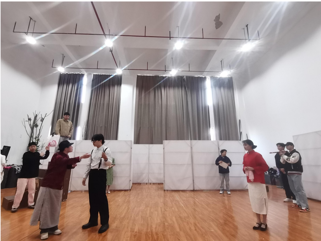
毕业设计作品实践中