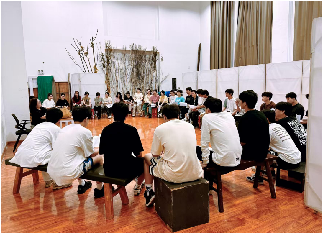
教师与学生讨论毕业设计选题