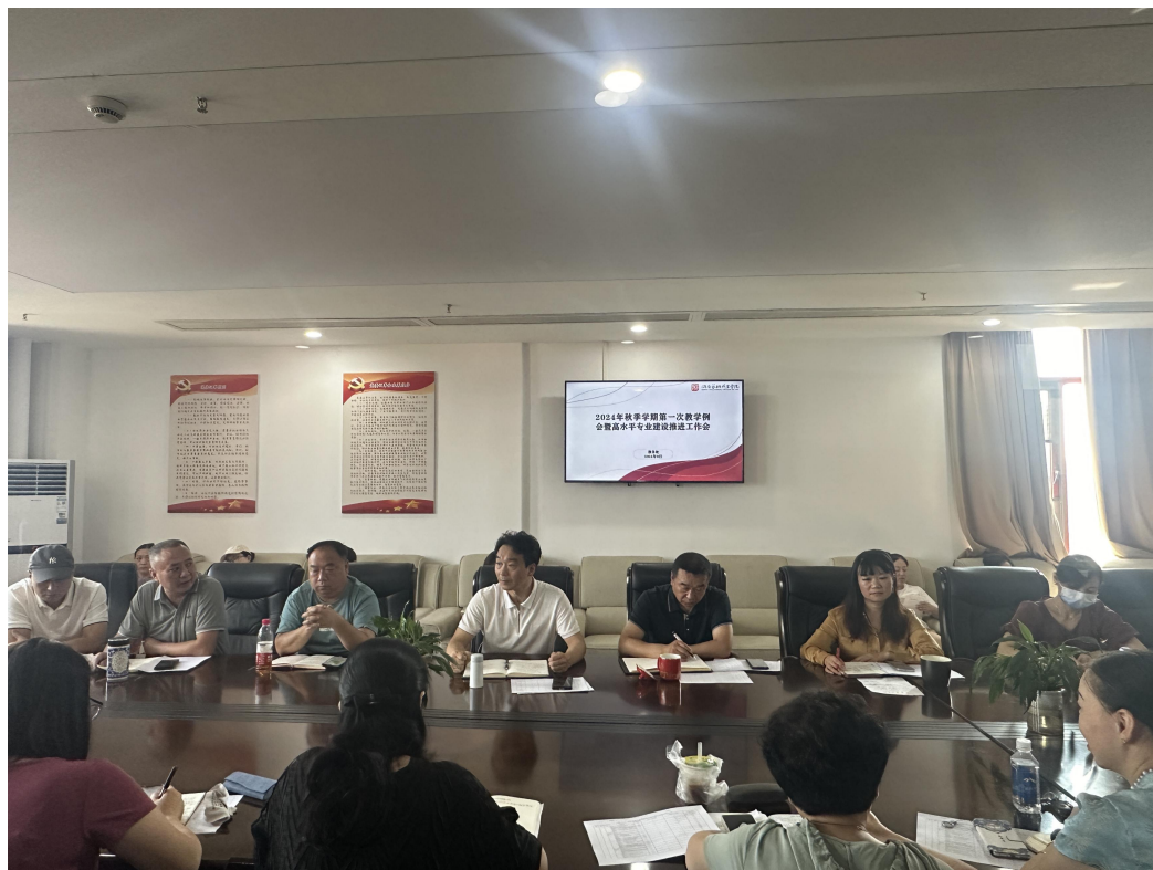
学校下达毕业设计任务