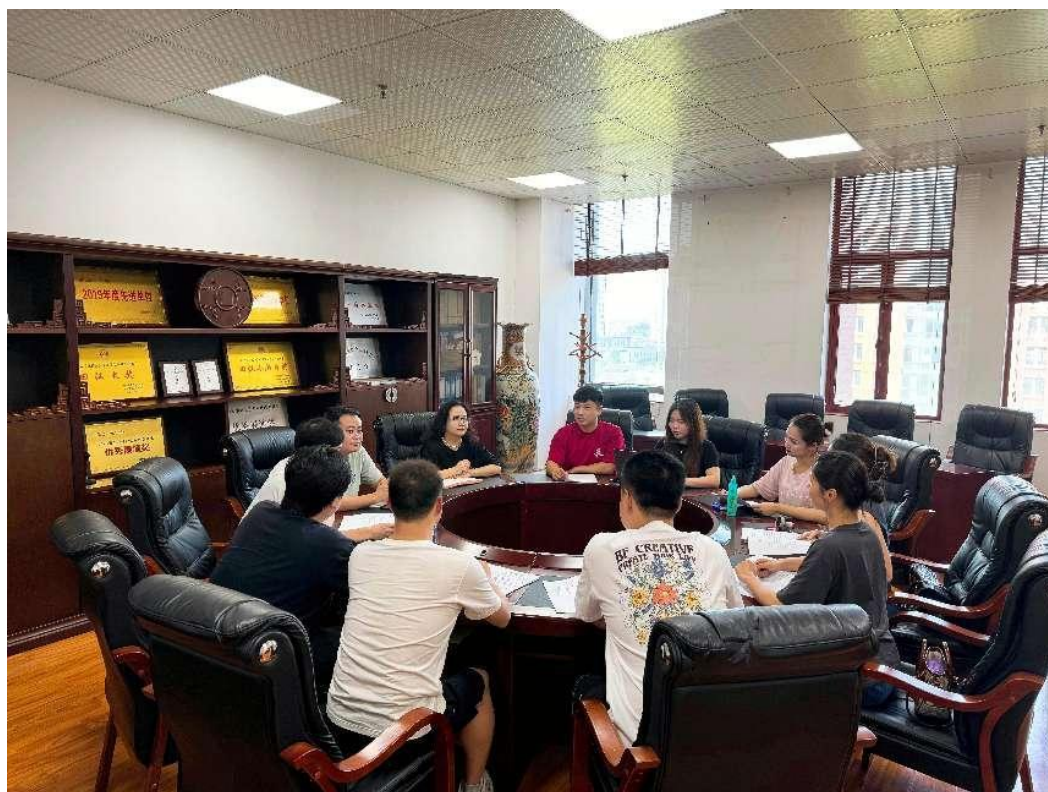
二级学院向教研室下达毕业设计任务