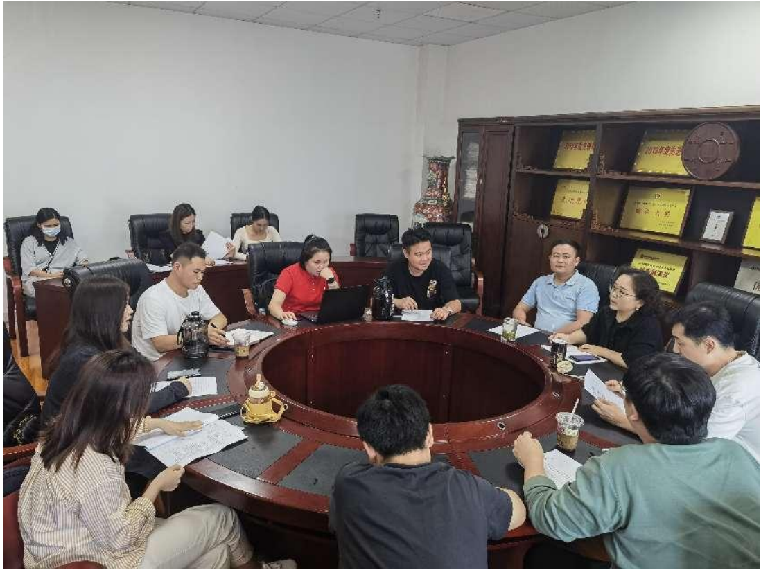
指导老师集中讨论毕业设计选题