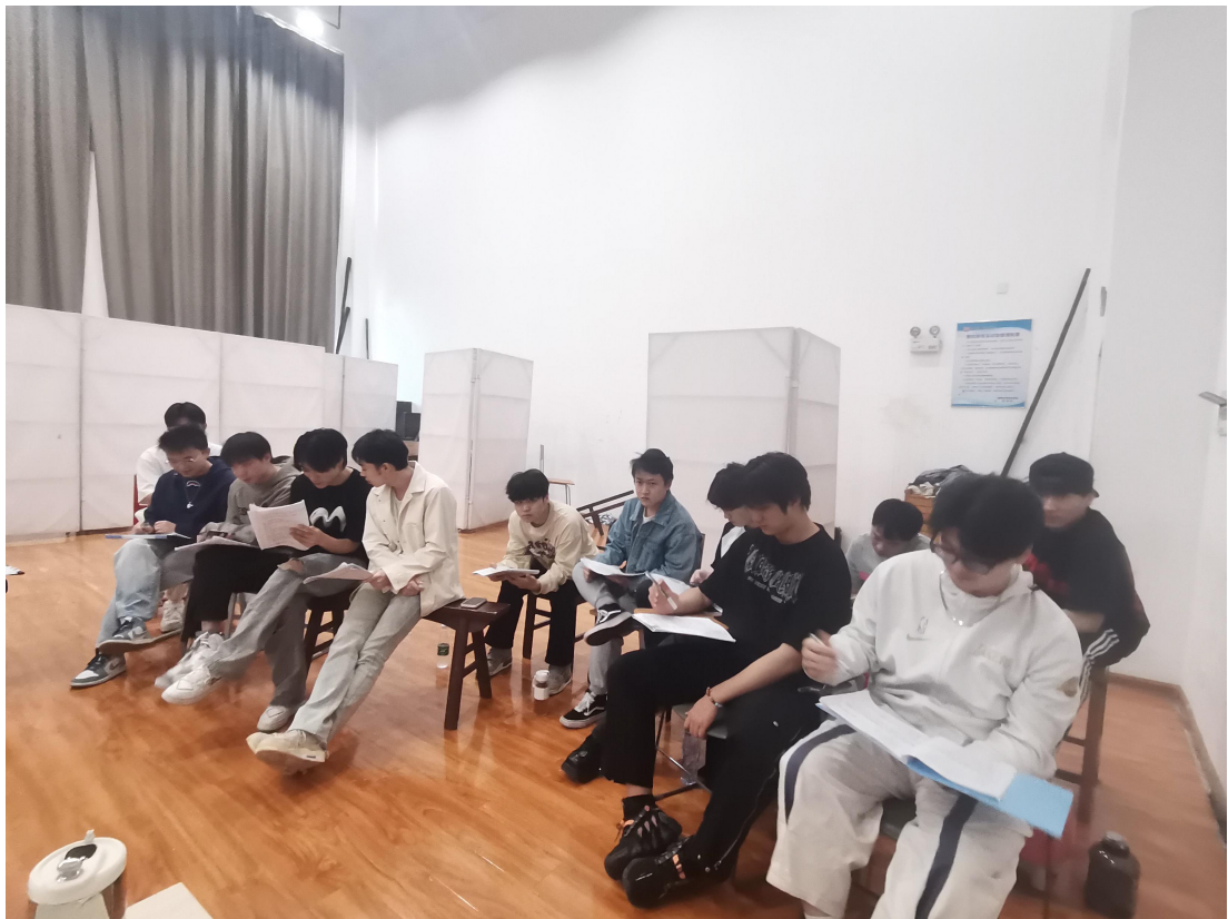
学生组讨论毕业设计选题