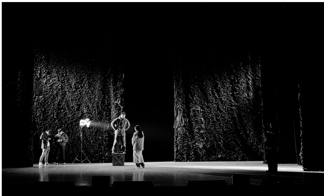
毕业设计作品合成