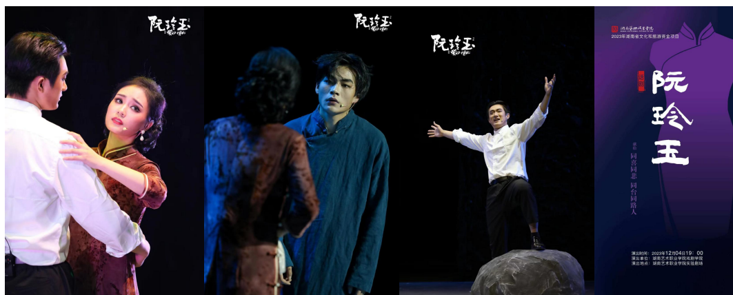
毕业作品正式演出