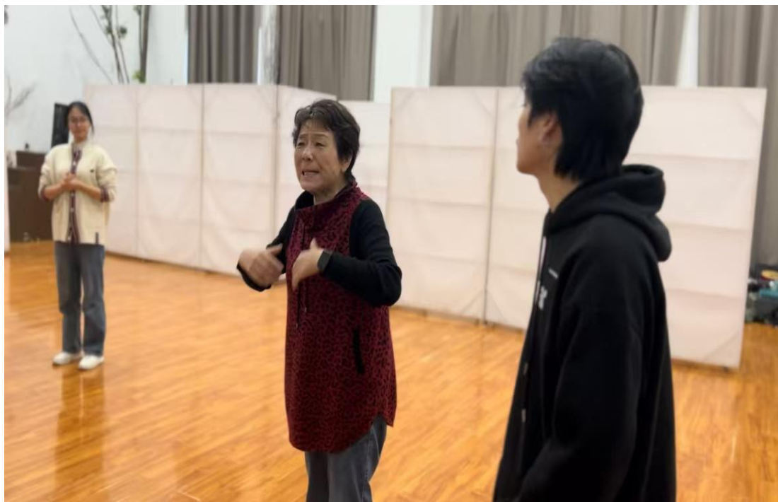
邀请行业专家进行指导