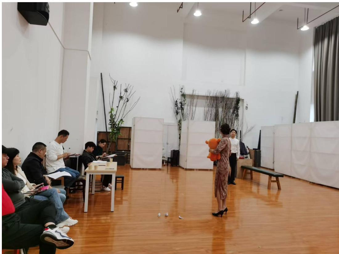
毕业设计作品中期检查